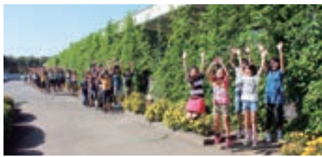
▲校舎を覆う緑のカーテン

今年で3年目となるこの取り組みは、パッションフルーツを中心にゴーヤやアサガオで校舎を覆いつくし、涼しい環境の中で子どもたちは勉強に励みました。