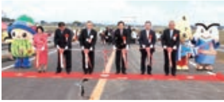
▶ちっくんも参加し、テープカット