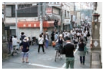
▲鷹場町での撮影風景

市内で全撮影が行われた映画「十字架」は、たくさんの方たちの協力で無事ロケ終了となりました。公開は、来年夏に予定されています。