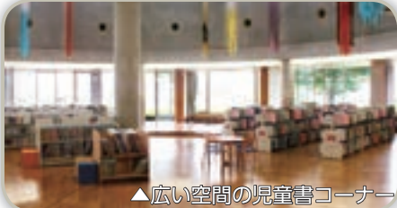
▲広い空間の児童書コーナー

児童書コーナー(中央図書館)は、部屋中が明るく、親子が一緒に本が読めるようにレイアウトを変更し、広々としたスペースが印象的です。紙芝居や大判の絵本もあり、子どもたちが目で見て楽しめる工夫もされ、床で直接本を広げられる広さになっています。