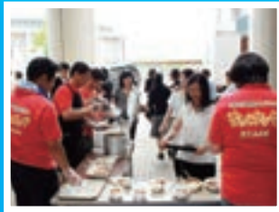
◀ちんぽんタングのご協力