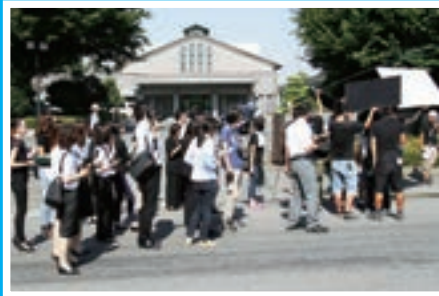
▲記者役のエキストラのみなさん