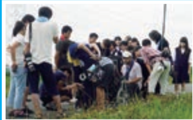
▲小貝川での撮影風景