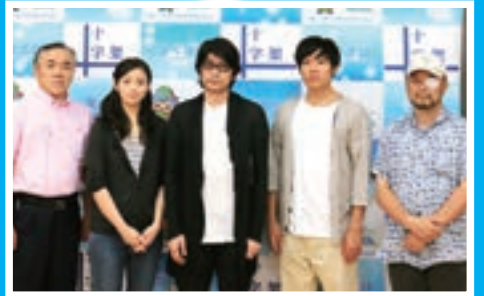
▲キャストのみなさん