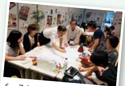
6~7人のグループごとに積極的な意見の交換が行われました。

11月に開催の報告会で、討議内容の報告書の提出と、応援歌を披露する予定です。みなさん、ちっくんの応援歌を楽しみにお待ちください!