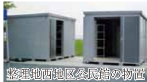
整理地西地区公民館の物置