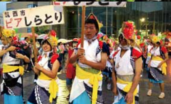
城西市 ピアしらとり