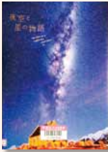
【パイインターナショナル】

はくちょう座、ペルセウス座、こいぬ座、うしかい座…。美しい星空の写真と、その星にまつわる物語を紹介します。「ヘルフレス12の冒険」「世界の七夕伝説」などのコラムも掲載。