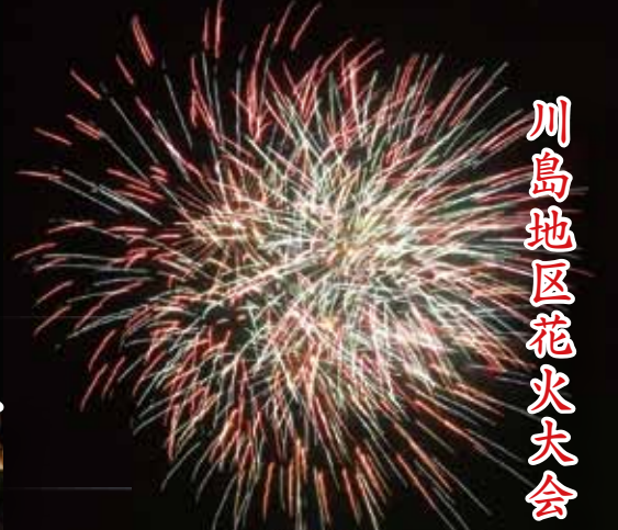
川島地区花火大会