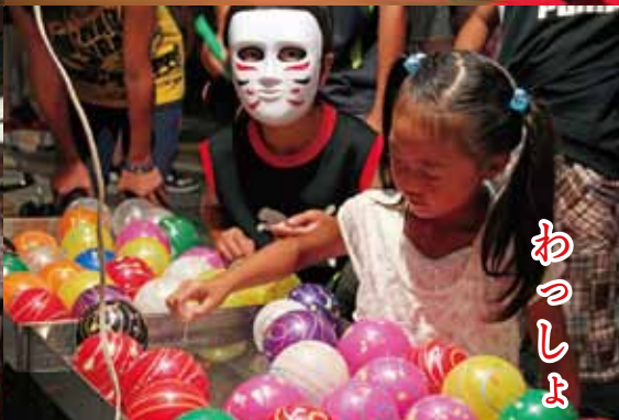
わっしょいカーニバル