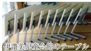
伊讚美児童会館のテーブル