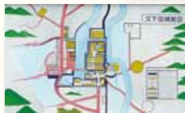
久下田城跡の碑と絵図