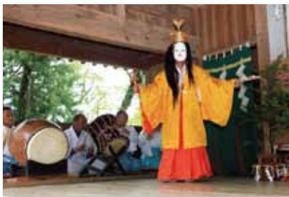
▲太々神楽保存会による神楽

勇壮な舞と融和的な舞とで構成され、内容は神々の功績をたたえ、平穏な自然と作物の豊穰を祈り、悪を払い幸福を祈願する神楽です。