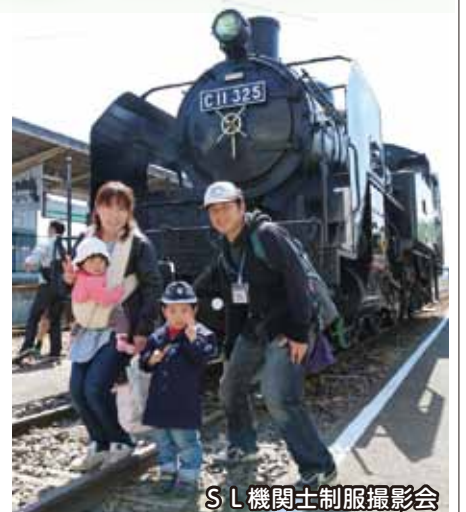
S L 機関士制服撮影会

スピカ1階では、前回も人気を集めた鉄道ジオラマや写真が展示され、鉄道の魅力を存分に伝えていました。