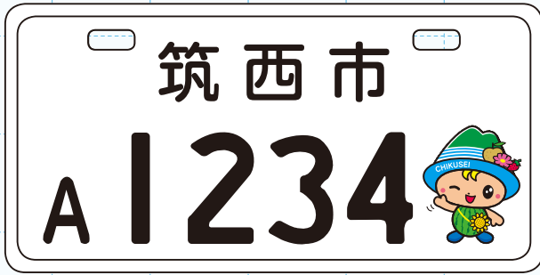
50cc 見本 (縦 10cm × 横 20cm)

市で交付しているナンバープレート (原付 50cc に限り) が、市マスコットキャラクター「ちっくん」をデザインしたものに変わります。