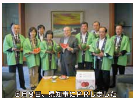
5月9日、県知事にPRしました

こだまスイカの出荷は、3月に始まり6 月にピークを迎えます。この時期にあわせ て、こだまスイカ産地活性化連絡協議会では、 様々なPRを行っており、その一環として、 市役所本庁舎1階エントランスホールにこだ まスイカPRブースを設置しました。