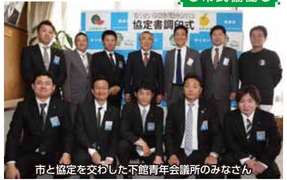
市と協定を交わした下館青年会議所のみなさん