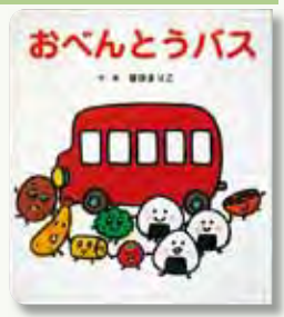
【ひさかたチャイルド】

「バスにのってください、ハンバーグくん」「はい」「えびフライちゃん」「はい」お弁当のおかずが次々にバス乗り込みます。楽しくてかわいい、赤ちゃんからの絵本。