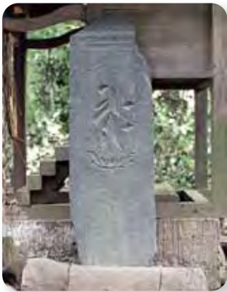
問 生涯学習課 ☎22-0183