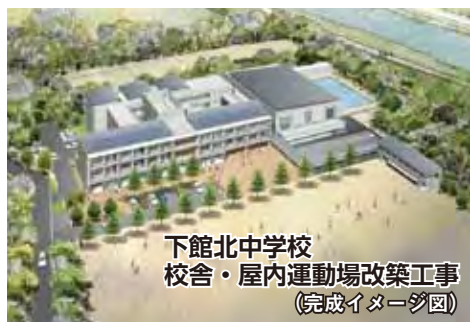
下館北中学校 校舎・屋内運動場改築工事 （完成イメージ図）

鉄筋コンクリート3階建。1階には職員室、校長室、メモリアルコーナーなど。2階には普通教室、多目的教室、美術室など。3階には普通教室、調理室、音楽室などが設けられます。