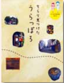
【札幌市教育委員会中央図書館】

「もうひとつの札幌」をテーマに投稿された市民からの写真をもとに、中高生が実際にその場所を取材し、札幌の魅力を紹介します。