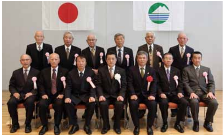
▲表彰式に出席された叙勲及び褒章受章者のみなさん