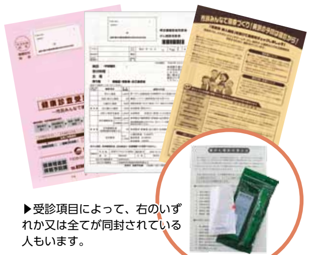
▶受診項目によって、右のいずれか又は全てが同封されている人もいます。

※筑西市国民健康保険以外に加入している40歳から74歳の人々が特定健康診査を受ける場合は、「特定健康診査受診券」が必要となりますので、勤務先にお問い合わせください。