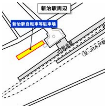
新治駅自転車等駐車場 問 都市計画課(管理事務所) ☎57-2718