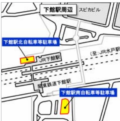
下館駅南・北自転車等駐車場 問 市民安全課 内線 460