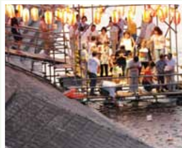
田村 正 (筑西市)