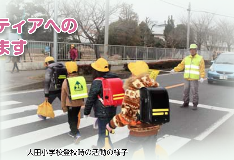
大田小学校登校時の活動の様子