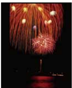
栗原 分平 (筑西市)