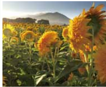
山口 定夫 (常総市)