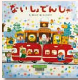
【ひさかたチャイルド】

春がきて雪がとけるまで、もりのてつどうはお休みです。おそろじを終えて、駅長さんが座席でいぬむりしていると…。楽しいし、かけ絵本です。