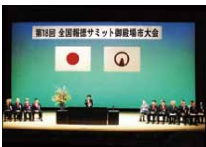
報徳精神を次世代につなぐことを確認した全国報徳サミット

江戸時代、報徳仕法を用いて 筑西市を含む多くの人や疲弊し た農村復興に生涯を捧げた郷土 ゆかりの偉人をしのぶとともに に、その思想を現代の社会に生 かそうと、二宮尊徳ゆかりの18 市町村が一堂に集いました。