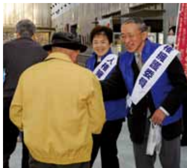
あけの元気館でのキャンペーンの様子

単位は、マイクロシーベルト/時間 測定日時：12月14日(金)・公園12月10日(月) 測定高さ：中学校は地上1.5m、その他は50cm