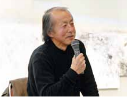
平成24年3月にしもだて美術館で行われたトークショーにて