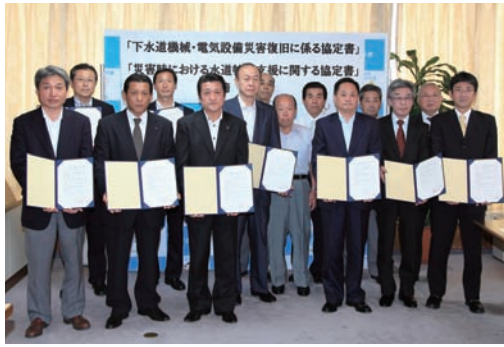
▲市と協定を結んだ事業所のみなさん

この協定により、災害時において汚水処理場の機械や電気設備の復旧支援、漏水箇所などの点検や確認、応急給水活動などの支援が期待されます。