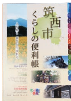
筑西市「くらしの便利帳」

「くらしの便利帳」の電子書籍化により、医療機関情報や市役所での各種行政手続方法などが、いつでもどこでも見たい時に見ることができるようになります。市の情報がより身近になります。