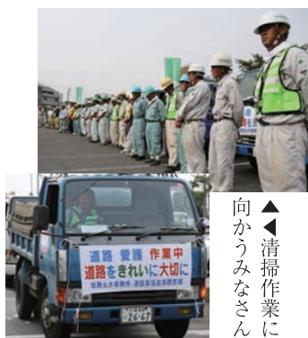
▲清掃作業に向かうみなさん