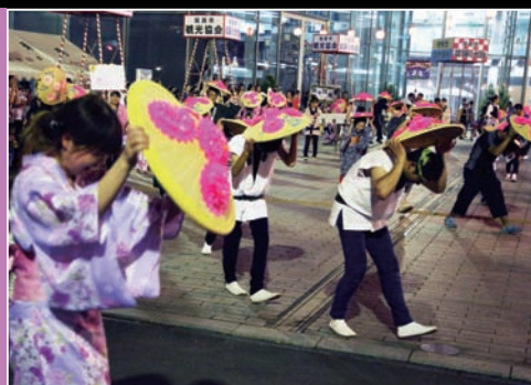
下館盆おどり 8月15～16日