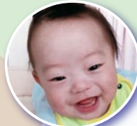
かみむら ほうたろう 上村 遥太朗くん 9月28日生(女方)