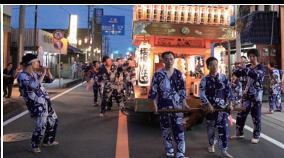
関本祇園まつり 7月21～22日