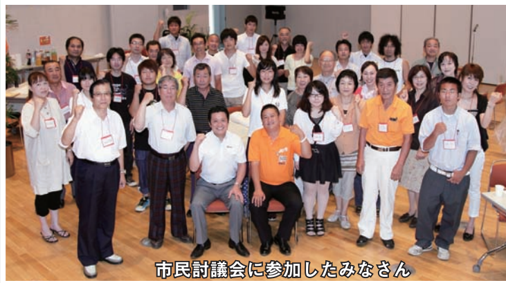
市民討議会に参加したみなさん