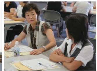
▶▼会議で活発に意見交換をする子育てアドバイザーのみなさん

責任ある役割を担っているため、自分磨きにも心掛けており、年4回の会議兼研修ではそれぞれの活動報告や問題点の提案と対処法などが活発に話し合われます。時には専門の方の講義も受け、よりよいアドバイザーを目指しています。子