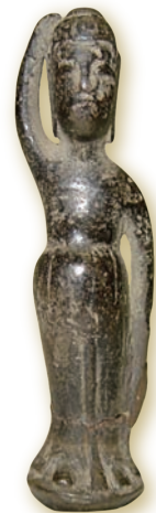
銅造誕生釈迦仏立像

同寺において、毎年4月8日のお釈迦様の誕生を祝う「花祭り」に使われていた誕生仏です。