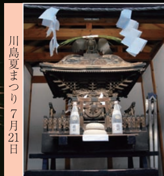
川島夏まつり 7月21日