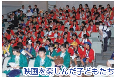
映画を楽しんだ子どもたち

2日目の土曜日には、地元の子ども達と一緒に、被災地である福島県南相馬市や今年5月に竜巻被害に遭ったつくば市北条地区の子どもたち約120人も、同映画を鑑賞しました。筑西市に「またいつか夏に。」遊びに来て欲しいものです。