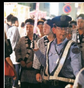
まつりを見守っていただきました