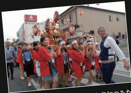
南相馬市やつくば市北条地区から参加のみなさん