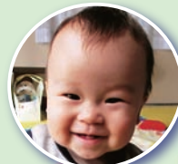
つばまつ いっさき 坪松 志咲くん 9月21日生(海老ヶ島)