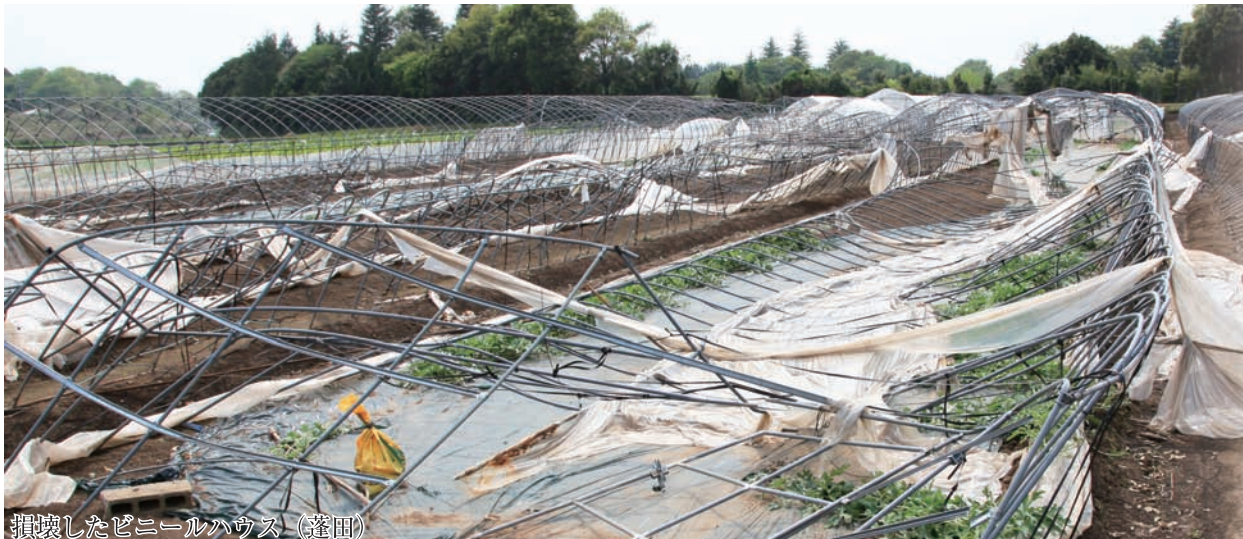
損壊したビニールハウス（蓬田）