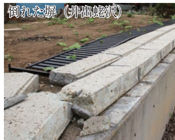
倒れた塀（井出蛭沢）