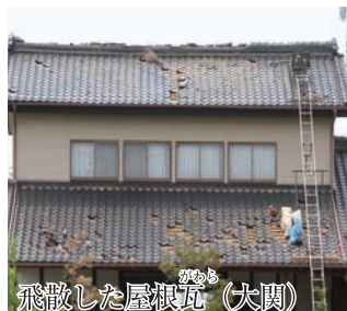
飛散した屋根瓦（大関）