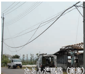
たるんだ電線（高島）