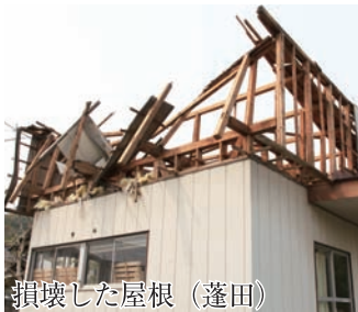
損壊した屋根（蓬田）