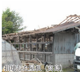
損壊した屋根（高島）