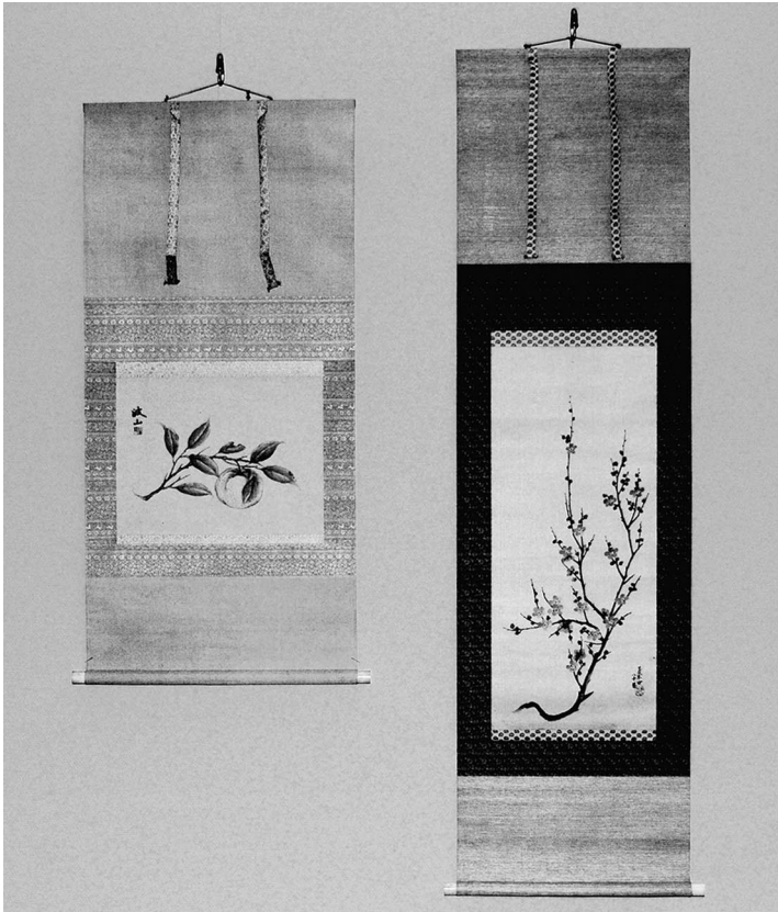
左・板谷波山作『三宝柑図』、右・板谷まる(玉蘭)作『紅梅図』