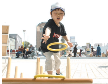
わっしょい市会場で開催された輪投げ大会。みんな、うまく投げられたかな。

4月17日の日曜日、波山先生とまる夫人の作品を撮影するためにしもだて美術館に向かうと、毎月恒例『わっしょい市』の開催日。新鮮野菜の産直青空市や街かどコンサート、フリーマーケットなどが開かれ、アルテリオ前は大勢の市民で賑わっていました。( )