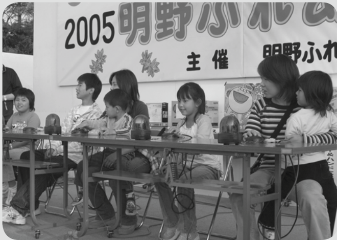
▲大勢が参加した○×クイズでは、正解が発表されるたびに歓声とため息が会場を包みました。ステージに残れたのは5人、最終的に3人が豪華賞品を獲得し大満足でした。