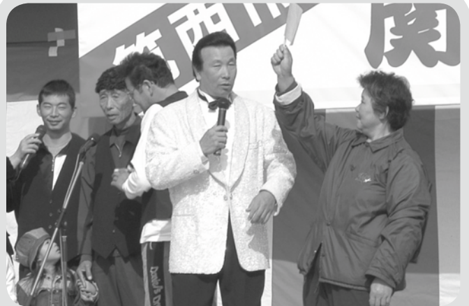
▲『後川清&ホットファイブ』ショーでは、『長崎は今日も雨だった』を一緒に歌いました。コーラスが合わなかったり音程がずれるなど、会場の笑いを誘いました。