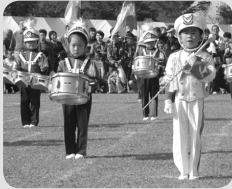
▲明野保育園マーチングバンドでは、園児たちの演技に惜しめない拍手が続きました。