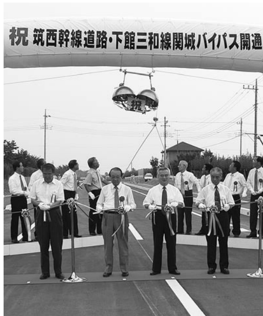
祝 筑西幹線道路・下館三和線関城バイパス開通