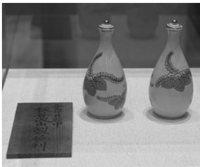
▲展示された波山作の徳利（金沢時代の作品）。