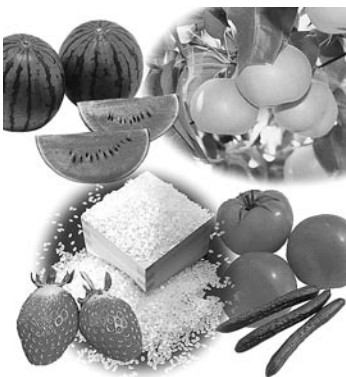
▶特産物の生産振興を図ります。

じめ関係団体と十分に連携して、中小企業の経営支援に努めます（6821万円）。市観光協会への団体や企業等の加入を促進します。