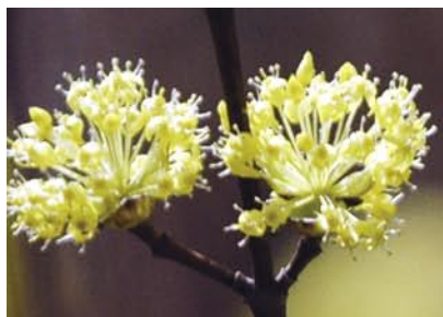
サンシュウ(ミズキ科) 早春の山や公園、庭園を彩ります。この時期、周りに花が少ないので目立ちます。

ウォーキング大会の取材に同行。注意事項と準備体操があり、いよいよコースへ。水戸市や牛久市、さらには県外の宇都宮市からも参加があり、ウォーキング熱の高まりと健康への関心があることに驚く。歩くスピードが思ったより速く、参加者の中には年配の人も多かったが、その健脚ぶりは目を見張るほど。日頃の運動不足を感じさせられた一日だった。(も)