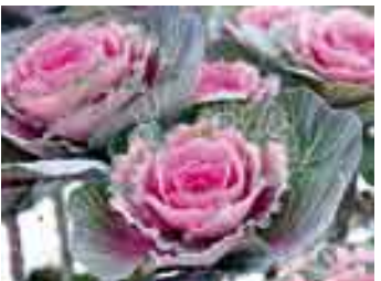
葉ぼたん（写真は切り花用の初紅）市内では11軒の花き農家が栽培。出荷の最盛期を迎えています。

編集後記 お節の昆布は「よるこ（んぶ）」、煮豆は「まめまめしく働く」など、いろいろな由来がある。今年の干支「亥」の象徴は、『勇気と冒険』。縁起話にあやかり、久しくしまい忘れて幾久しいチャレンジする気持ちを、今年はお節から出してみよう。（も） 『おつこ』こと渡辺良子さんを取材。タイプライターの『◎』などの文字を重ねて打ち、1枚の絵画を完成させるタイプアート。気の遠くなるような作業が必要だ。渡辺さんが全力を傾けた作品たちを、みなさんもぜひご覧になってください。（8） 12年前の亥年には阪神淡路大震災や地下鉄サリン事件が発生し、その後の社会に長く暗い影を落としました。この教訓を生かし今年が猪（いのしし）の亥のように、力強く、たくましい日本の幕開けの年となるように願っています。（ま）