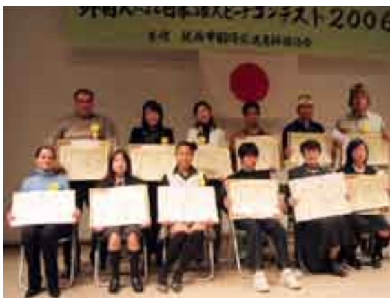
スピーチコンテストに出場したみなさん

「外国人による日本語スピーチコンテスト」が、12月9日、スピカ・コミュニケーションプラザで開催されました。