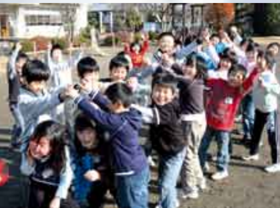
かわま 河間小学校