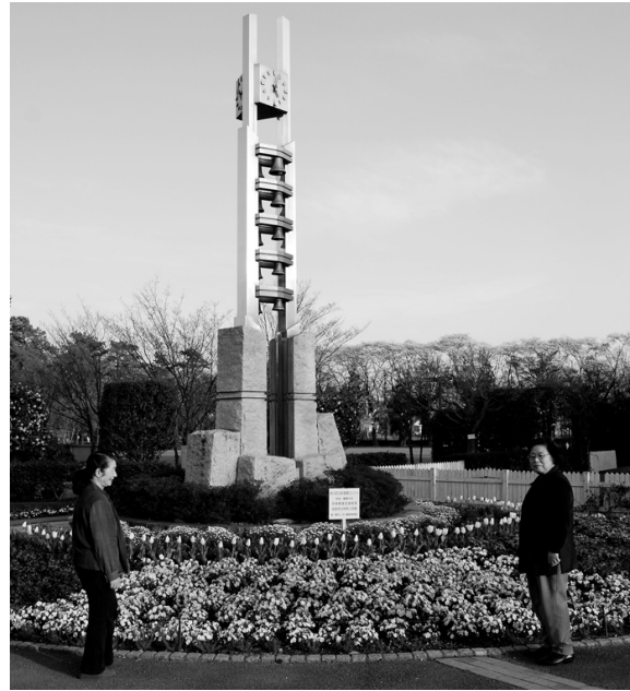
天空をめざし、限りない発展を願って設置されている明野公民館の時計台『カリヨンの鐘』。時計台の周りでは四季折々の花を楽しむことができます。

平成18年度末の基金残高は、財政調整基金残高が約7500万円、減債基金が約12億円。これに特定目的基金および定額運用基金を加えた基金残高合計は約40億円です。