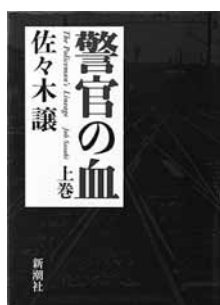
警官の血 著=佐々木讓 【新潮社】

◆昭和32年、天王寺駐在所長の安城清二が橋から転落死した。彼が火災現場の寺を離れて死んだ理由とは? 戦後闇市から現代までの安城家を軸に、その死の謎と、理想の警官像を探る物語。