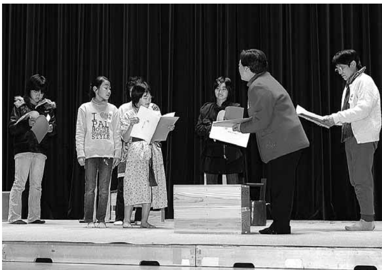
▲公演に向けて練習に励む劇団「ゴン太」のみなさん

演劇を通して、少しずつ成長している子どもたち。この子たちが、これから大きく羽ばたいていくことを願っています。みなさんも、ぜひ応援してください。