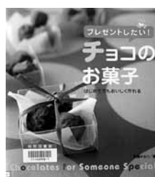
プレゼントしたい! チョコのお菓子 著=石橋かおり 【大泉書店】

◆初めてでもおいしく作れるチョコの本。生チョコ・トリュフや、電子レンジ、フライパン、オーブンを使った菓子が紹介されています。時間・難易度・保存期間別の索引つき。