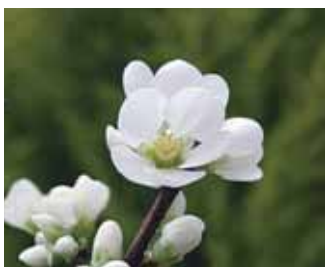
ボケ(木瓜) パラ科の落葉低木で、庭園樹としてよく利用され、盆栽にも用いられる。実を果実酒などにすることもある。

ペアノで素晴らしいダンスや演技を披露した子どもたち。練習は大変だったでしょうが、舞台上のみんなはキラキラ輝いていました。この経験が、将来きっと役に立つはず。(あ)