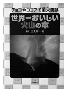
世界一おいしい火山の本 著=林信太郎 【小峰書店】

◆火山の石や墓石のほとんどは噴火でできたもの。そんな火山の動きを実験しよう! 使うものは、コーラや、マヨネーズ、チョコレートなど。実験して楽しい、食べて美味しい火山の本。