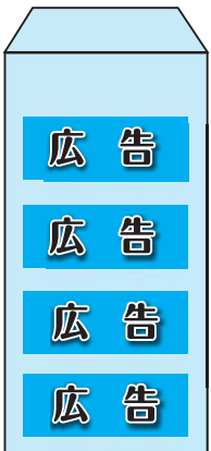
規格 (40mm x 100mm)

市では、新たな財源の確保と地域経済の活性化を図ることを目的に窓口用封筒等に有料の広告枠を設けます。ぜひ活用してください。▼広告例 長3封筒裏面4カ所