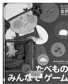
きょうからはじめる食育のえほん4 たべものみんなでゲーム (シリーズ全5巻) 監修=服部栄養料理研究会 絵=かべや ふよう 【ポプラ社】

◆おはしをしつかりもてるかな? よくかんてるかな? 楽しみながらきちんと食べる。そこから食育が始まります。食べものを選択する力の養成と、食を通じてのしつけについて伝える絵本。