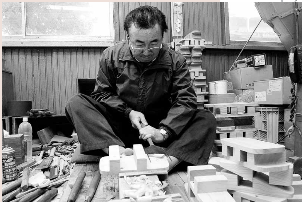
猪ノ原桐材木工所 Tel. 37-6108 http://www.kirinohana.com