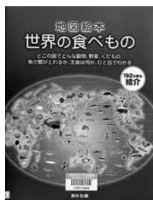
世界を食べもの 編=素朴社 【素朴社】

◆どこの国でどんな食べものか、とれてどのように食べられているか、192か国すべての国を紹介。食生活から世界の国々の姿が見えてくる。調べ学習などの「食」学習に最適な地図絵本。