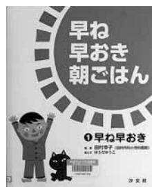
早ね早おき朝ごはん ①早ね早おき (シリーズ全3巻) 絵と文=はらだ ゆうこ 監修=田村 幸子 【汐文社】

◆元気のためには十分な睡眠が欠かせない。睡眠不足が原因で生じる体のトラブルや早寝早起きができるためのコツ、身につけたい朝の習慣などを、イラストでわかりやすく解説する絵本。