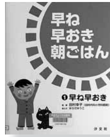
早ね早おき朝ごはん ①早ね早おき(シリーズ全3巻) 絵と文=はらだ ゆうこ 監修=田村 幸子 【汐文社】

◆元気のためには十分な睡眠が欠かせない。睡眠不足が原因で生じる体のトラブルや早寝早起きができるためのコツ、身につけたい朝の習慣などを、イラストでわかりやすく解説する絵本。