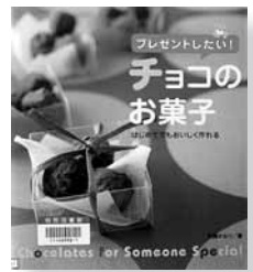
プレゼントしたい! チョコのお菓子 著=石橋かおり 【大泉書店】

◆初めてでもおいしく作れるチョコの本。生チョコ・トリュフや、電子レンジ、フライパン、オーブンを使った菓子が紹介されています。時間・難易度・保存期間別の索引つき。