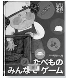
きょうからはじめる食育のえほん4 たべものみんなでゲーム (シリーズ全5巻) 監修=服部栄養料理研究会 絵=かべや ふよう 【ポプラ社】

◆おはしをしつかりもてるかな? よくかんてるかな? 楽しみながらきちんと食べる。そこから食育が始まります。食べものを選択する力の養成と、食を通じてのしつけについて伝える絵本。