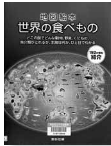
世界の食べもの 編=素朴社 【素朴社】

◆どこの国でどんな食べものか、とれてどのように食べられているか、192か国すべての国を紹介。食生活から世界の国々の姿が見えてくる。調べ学習などの「食」学習に最適な地図絵本。