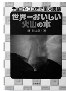
世界一おいしい火山の本 著=林信太郎 【小峰書店】

◆火山の石や墓石のほとんどは噴火でできたもの。そんな火山の動きを実験しよう! 使うものは、コーラや、マヨネーズ、チョコレートなど。実験して楽しい、食べて美味しい火山の本。