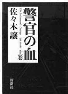
警官の血 著=佐々木讓 【新潮社】

◆昭和32年、天王寺駐在所長の安城清二が橋から転落死した。彼が火災現場の寺を離れて死んだ理由とは? 戦後闇市から現代までの安城家を軸に、その死の謎と、理想の警官像を探る物語。